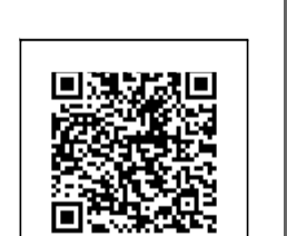
太原市第十九中学校