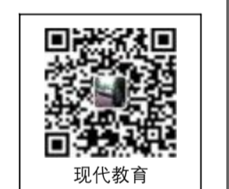
现代教育投稿微信号