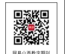
网易山西数字期刊