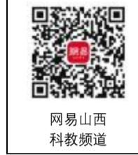
网易山西 科教频道