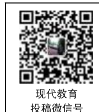
现代教育 投稿微信号