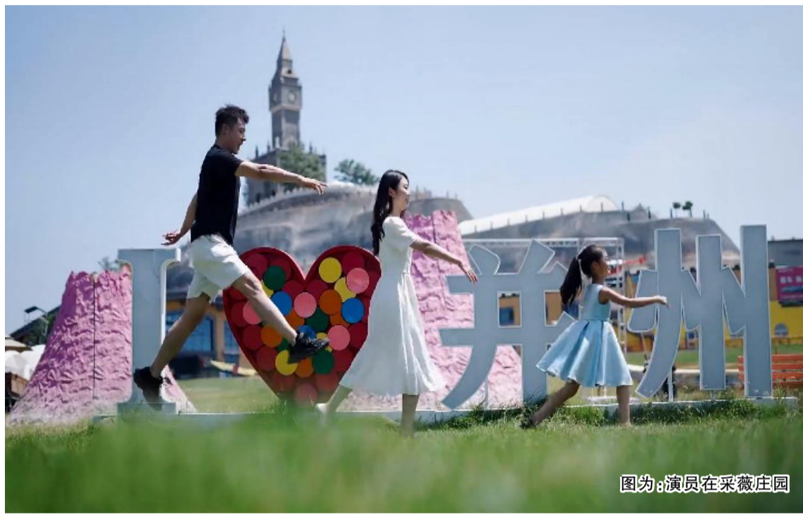
图为:演员在采薇庄园

我觉得无论是富养还是穷养,首先应该是教养。穷不过三代,富不过三代,以道德传家却可以传十代。德是一个人的根本,在这个世界上有德才能有得,厚德方可成家。我们如果过分地强调对孩子天性的释放,忽视了孩子“责”和“德”的培养,这种毫无信仰的绝顶聪明,终究是不可善终的。父母的爱是伟大无私的,但是一定不是无偿。开学了当您还在拼命地给孩子的行李箱塞满母爱的时候,当您的孩子和您毫不留情伸手要钱的时候,您不是也要问一下您的孩子?孩子等父母老了,你如何回报含辛茹苦的父母。