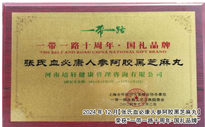
2024年12月【张氏血必康人参阿胶黑芝麻丸】荣获“一带一路十周年·国礼品牌”