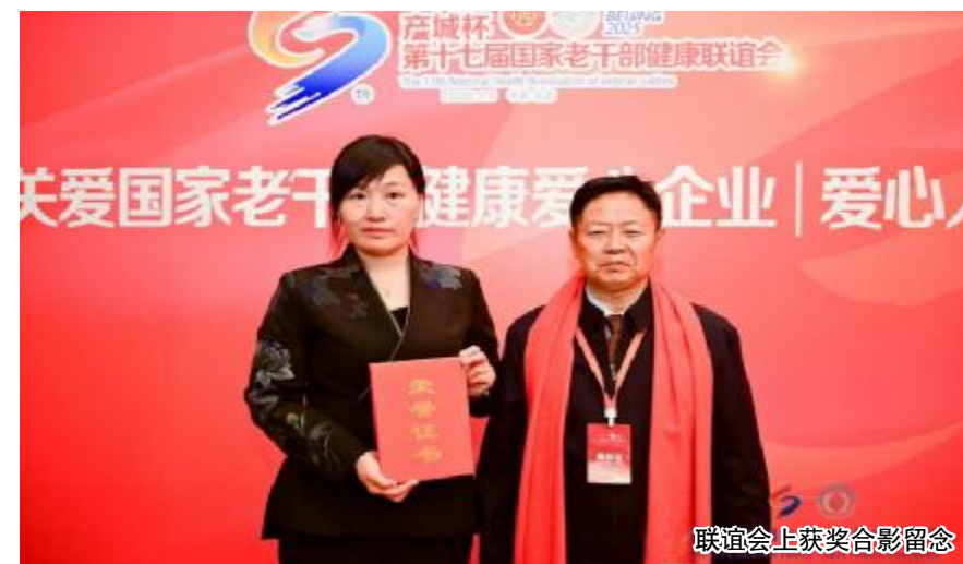
联谊会上获奖合影留念