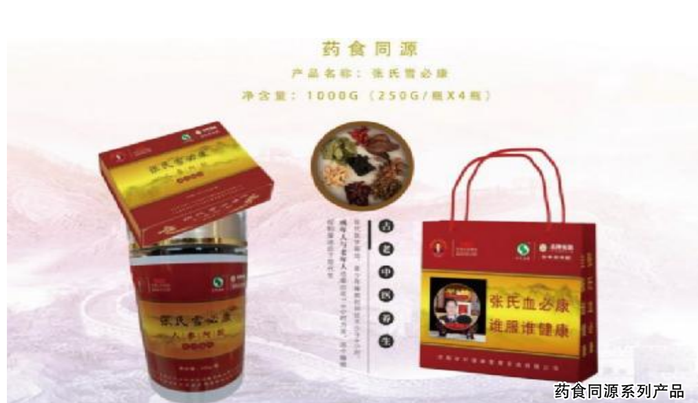
药食同源系列产品

誉。2023年,他的事迹被收入《中华名医列传》,成为首位入选该典籍的赤脚医生出身的专家。