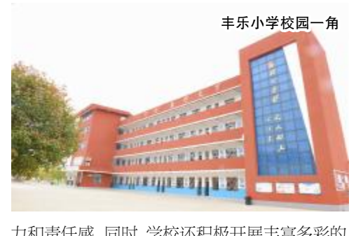
丰乐小学校园一角

生共同成长。 加强校园安全,保障和谐环境 安全是校园工作的首要任务。钟祥市丰乐镇小学深知安全的重要性,因此采取了一系列措施加强校园安全管理。学校实行严格的门禁制度,对外来人员进行严格登记和审查,确保校园治安安全。同时,学校还建立了值班制度,安排教师在课前、课间、午间进行巡视,及时发现并处理各种安全隐患。 此外,学校还注重学生的安全教育,定期开展安全知识讲座和演练活动,提高学生的安全意识和自我保护能力。通过建立课桌点名制度、签订安全责任书等措施,学校确保了学生的安全得到全方位保障,为校园的和谐稳定提供了有力支撑。 注重德育实效,培养全面人才 德育是学校教育的灵魂。钟祥市丰乐镇小学在德育方面同样下了功夫。学校通过加强学生会干部队伍建设,培养学生的自我管理能