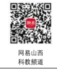
网易山西 科教频道