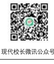
现代校长微信公众号