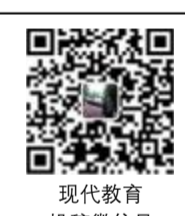
现代教育 投稿微信号