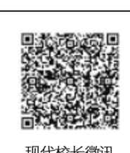
现代校长微信 (今日头条)