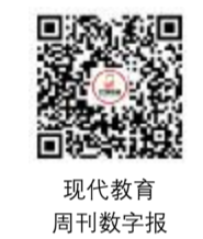
现代教育 周刊数字报