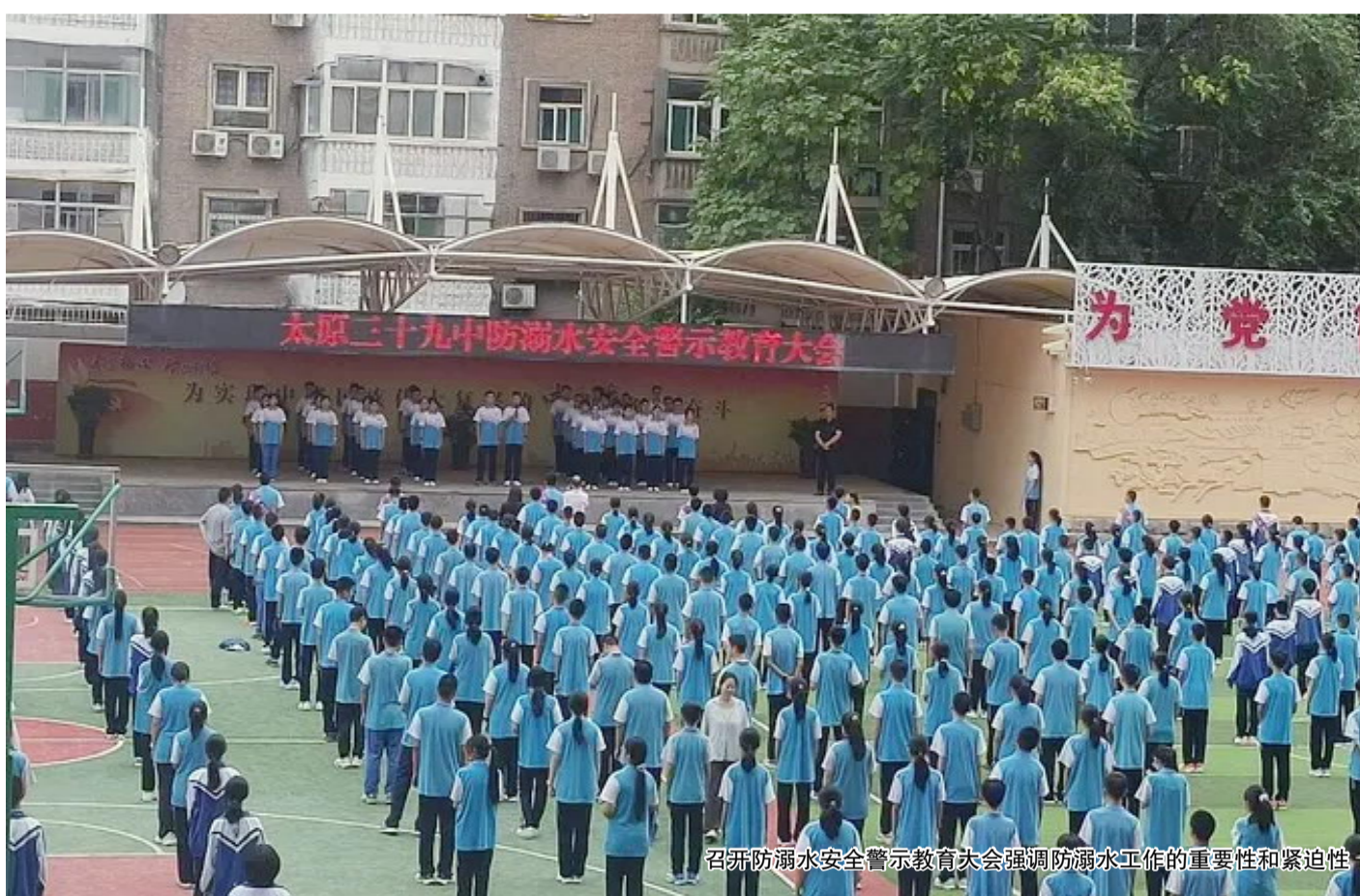
召开防溺水安全教育大会强调防溺水工作的重要性和紧迫性

科学导报讯 为切实增强全校学生的防溺水安全意识,提高自救互救能力,保障学生生命安全,暑假前夕,太原市第三十九中学举行了2025年暑期防溺水安全教育活动,通过多种形式,借助各个平台,对学生进行防溺水安全教育提醒,引导学生紧绷生命安全之弦。